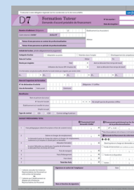
DPC formation tuteur